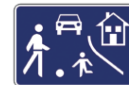
Območje umirjenega prometa

Policist je na cesti zato, da otrokom pomaga in jih varno usmerja v prometu. Grožnje, da ga bo videl ali celo kaznoval policist, če naredi kaj narobe, zato niso primerne.