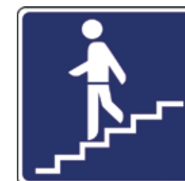
Podzemni prehod za pešce