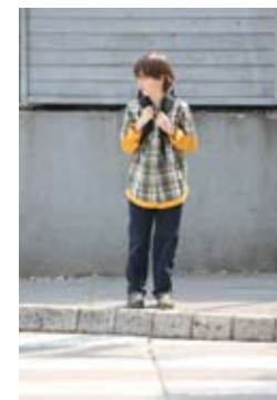
3. Pogledam na desno