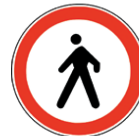
Prepovedano za pešce