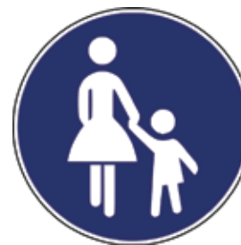
Steza za pešce

Otroci bi morali poznati predvsem prometne znake, ki pešce obveščajo o varni hoji, jim zapovedujejo ravnanje ali prepovedujejo hojo.