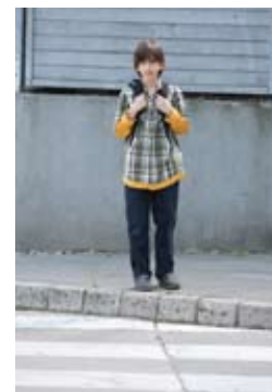
1. Ustavim se na robu pločnika

Potem, ko se prepričamo, da se otrok zna ustaviti ob robu pločnika in opazovati promet, začnemo z najtežjim delom, prečkanjem ceste. Prva prečkanja naj bodo na ozki, neprometni cesti. Poseben problem je, ker otrok ni sposoben ugotoviti razdalje in hitrosti vozil. Zato ga navajamo na to, da prečka cesto le, če z obeh strani ne prihaja nobeno vozilo ali takrat, ko voznik ustavi in mu jasno pokaže, da lahko prečka cesto.