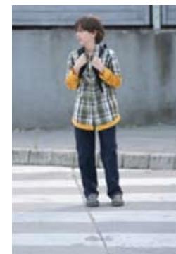
6. Na sredini ceste še enkrat pogledam na desno.