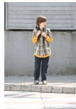
4. Še enkrat pogledam levo