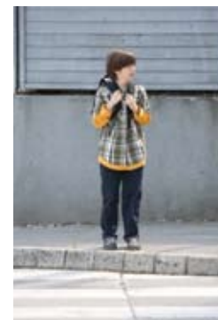
2. Pogledam na levo