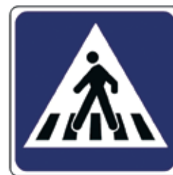
Prehod za pešce