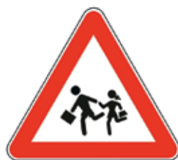
Otroci na cesti

Prometni znaki s svojimi barvami in simboli otroke vedno pritegnejo. Brez težav se naučijo njihova imena, več problemov pa imajo pri tem, kako je potrebno ravnati. Nekaj znakov otroke izredno moti in jih razumejo popolnoma narobe. Simbole si razlagajo po svoje in tako tudi ravnajo. Najbolj znan znak, ki spodbuja otroke k napačnem ravnanju, je znak Otroci na cesti, ki opozarja voznike, da prihajajo na območje, kjer so na cesti pogosto otroci. Zaradi simbola dveh otrok v teku pa ga otroci lahko razumejo tako, da je treba pri tem znaku steči čez cesto.